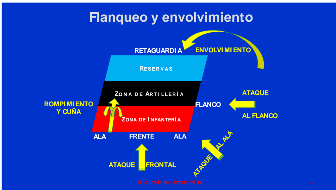
Croquis de ataque a alas, flancos y envolvimiento

Los ataques a las alas, a los flancos y los envolvimientos, son en general las mejores opciones para minimizar los daños propios y hacer al enemigo perder el control de las acciones.